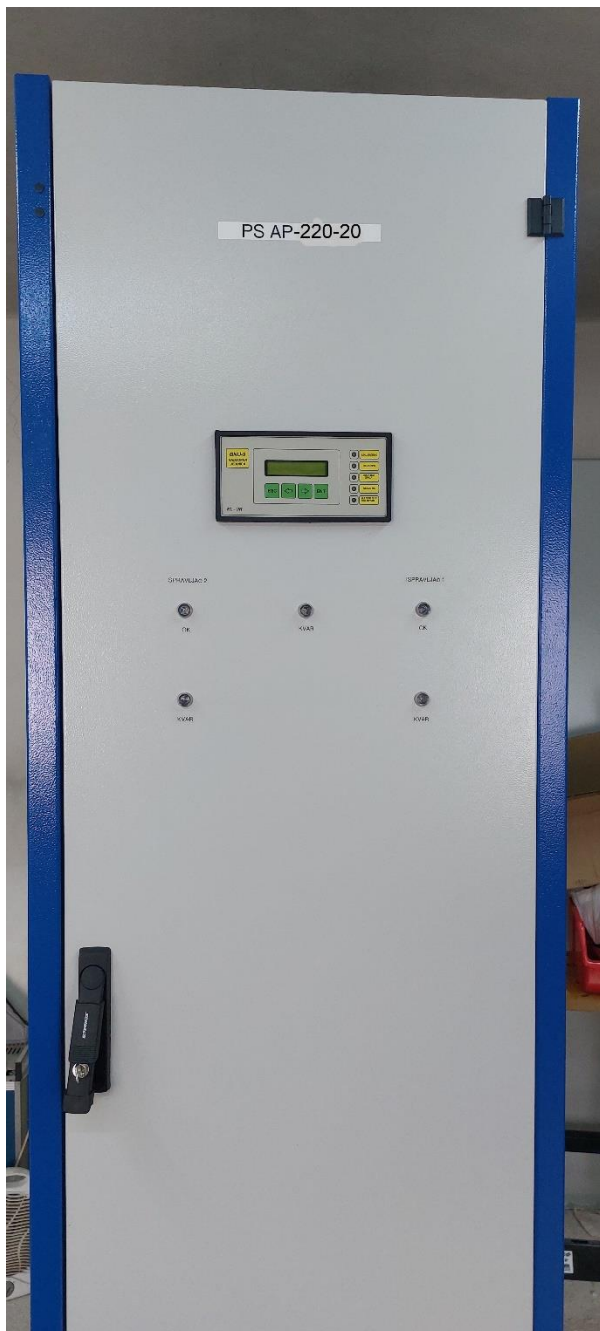
Sl. 1 – vanjski izgled sustava