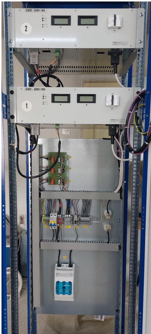
Sl.3 – unutarjni raspored opreme